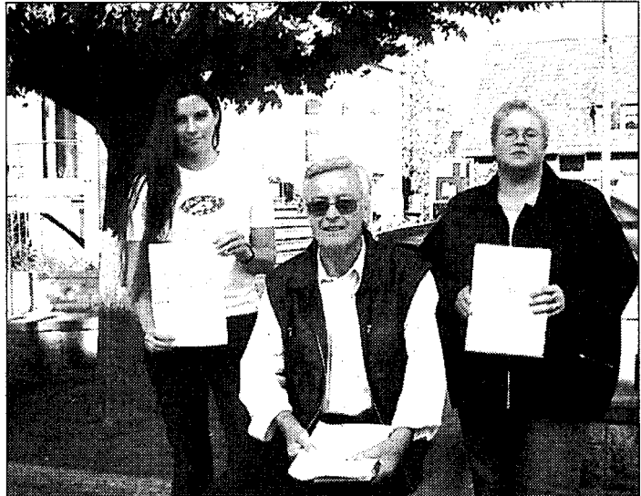
Der Behindertenbeirat der Samtgemeinde Rodenberg überreicht am 5. Mai der Niedersächsischen Sozialministerin eine Aktionsliste, um ein Gleichstellungsgesetz voranzutreiben.